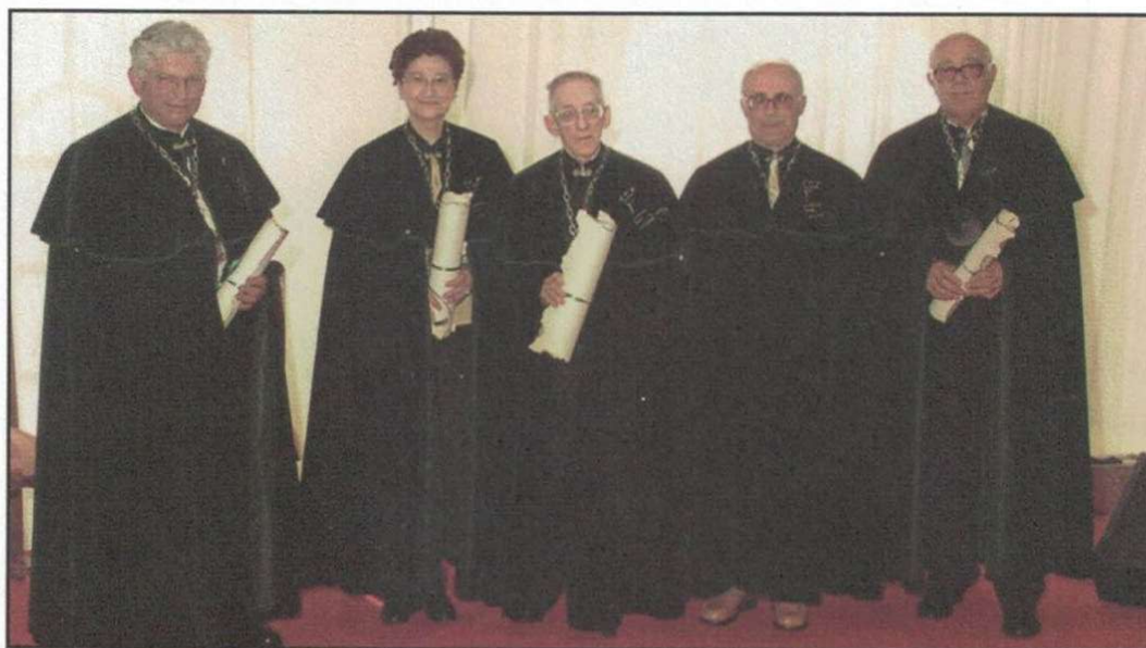
Ano 2003. Os primeiros investidos

Créase a Orde do Mariscal coa finalidade de recoñecer e premiar os méritos sociais, culturais ou empresariais a ilustres e destacados persoeiros vinculados á comarca, dada a súa contribución e participación no desenrolo e progreso da Mariña Lucense, sendo investidos (cos atributos da Orde) como insignes Cabaleiros do Mariscal Pardo de Cela e Donas de Sabela de Castro (a súa muller), o Día do Mariscal , festa que se celebra anualmente na última semana de agosto.