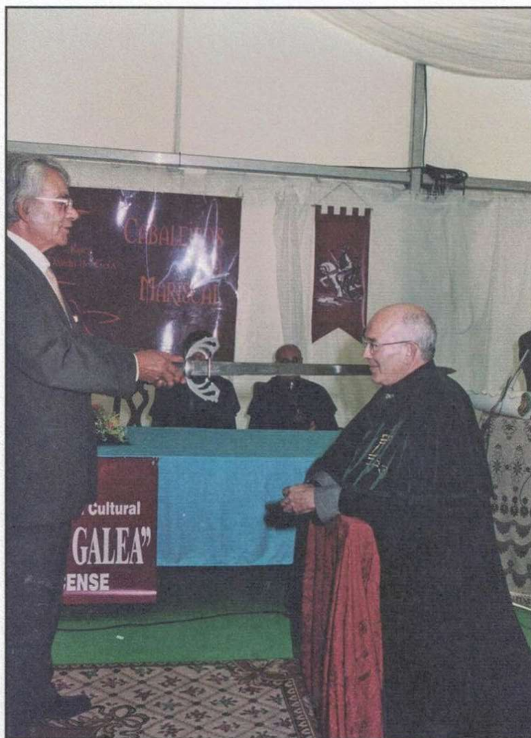
Acto de investidura